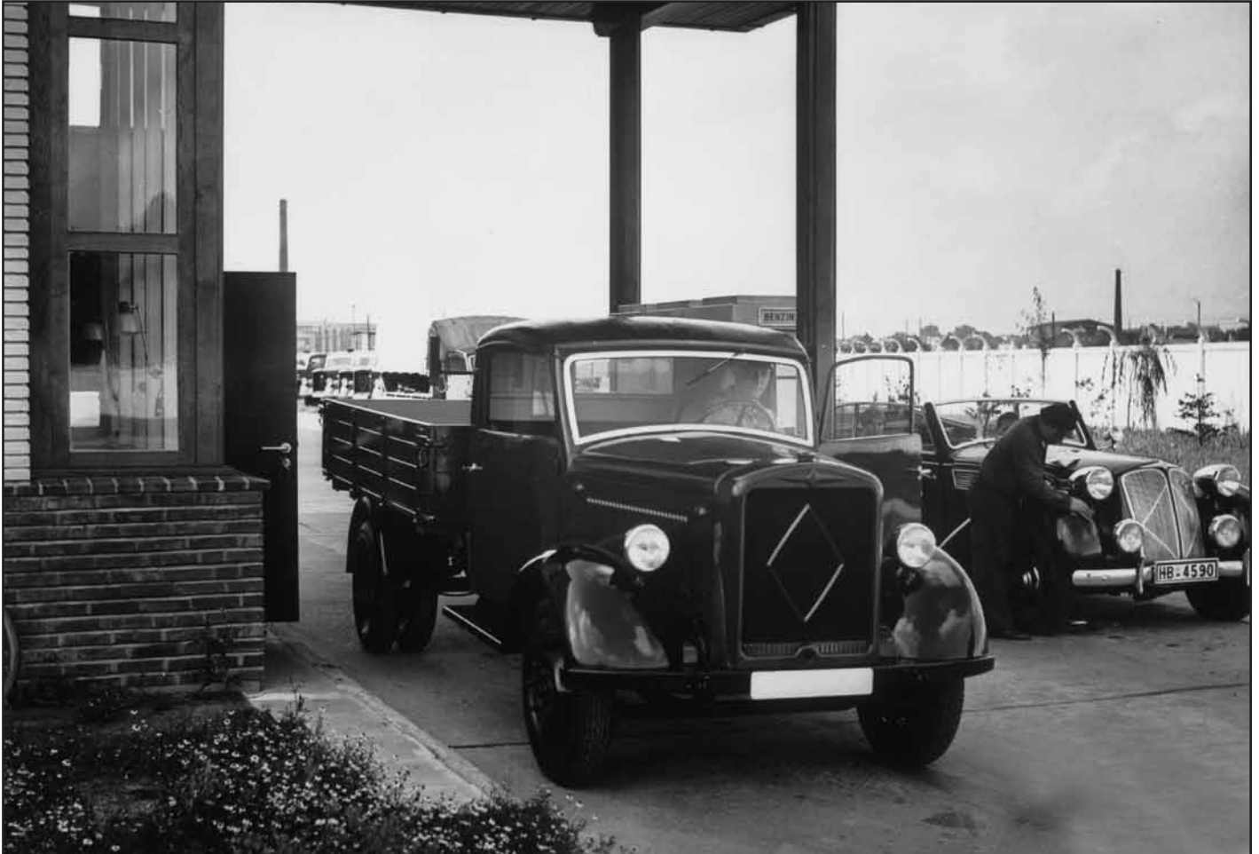
Borgward LKW L 2000 S und PKW 2000 Sportcabriolet vor der Betriebstankstelle im Werk Sebaldsbrück.

Dem für 2950 RM angebotenen Hansa 1100 folgt alsbald der um 500 RM teurere, gleichfalls