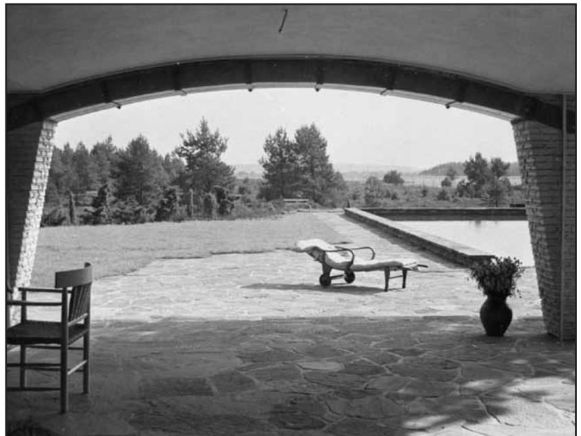
Freisitz mit Blick auf das Schwimmbad und die Heidelandschaft.